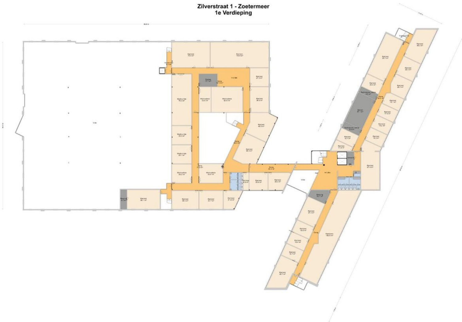
Zilverstraat 1 - Zoetermeer 1e Verdieping